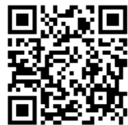
報名網址 QR CODE

（一）為利活動籌備，即日起至 5 月 25 日（星期四）17 時止，至 Google 表單（網址： https://forms.gle/mp4rp6RhtbkebcKa7 ）填寫報名資料。若有登錄疑義請洽台北市電腦商業同業公會曾小姐及高小姐，電話 02-25774249 轉 323、899。